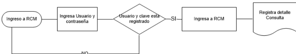
Figura 1 Sistemas de Ingreso a RCM